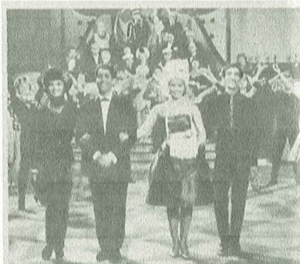
Prominente Gäste beherbergt Torrianis Hotel „Victoria“. Im Mittelpunkt steht das dänische Schlagerstimmchen Vivi Bach. Das Nachtblinde Startel gab an der Seite von Vico Torriani ihr erstes großes Bildschirmebüt